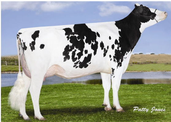
RUSSELLWAY CAMERON PINKY FIFTH DAM