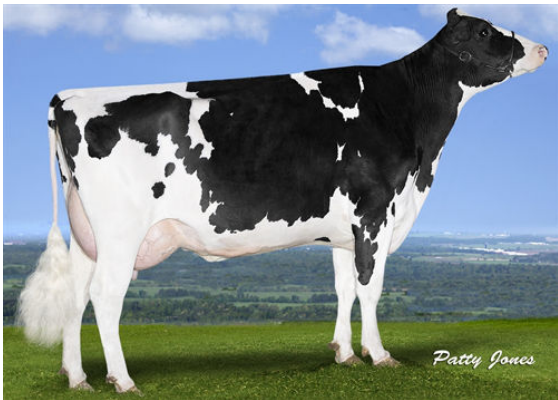
PROGENESIS ENFORCER PAT FOURTH DAM